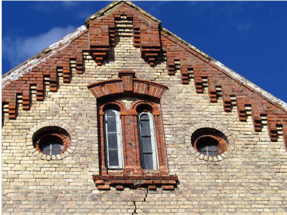
att. 21. Korpusa 1 frontona dekoratīvā apdare. Skats no ielas puses.