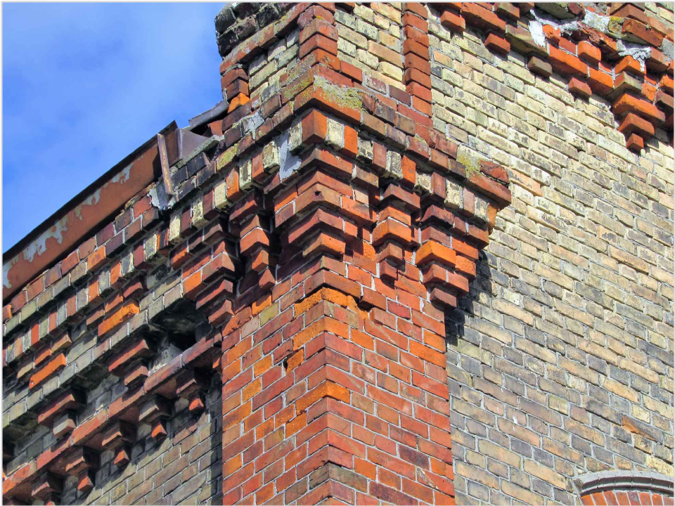
att. 19. Korpuss 2. Stūra pilastra kapitelis un dzega.