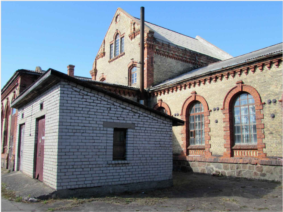
att. 18. Korpuss 3 ar piebūvi 6. Priekšplānā XX gs. 2. puses piebūve A.