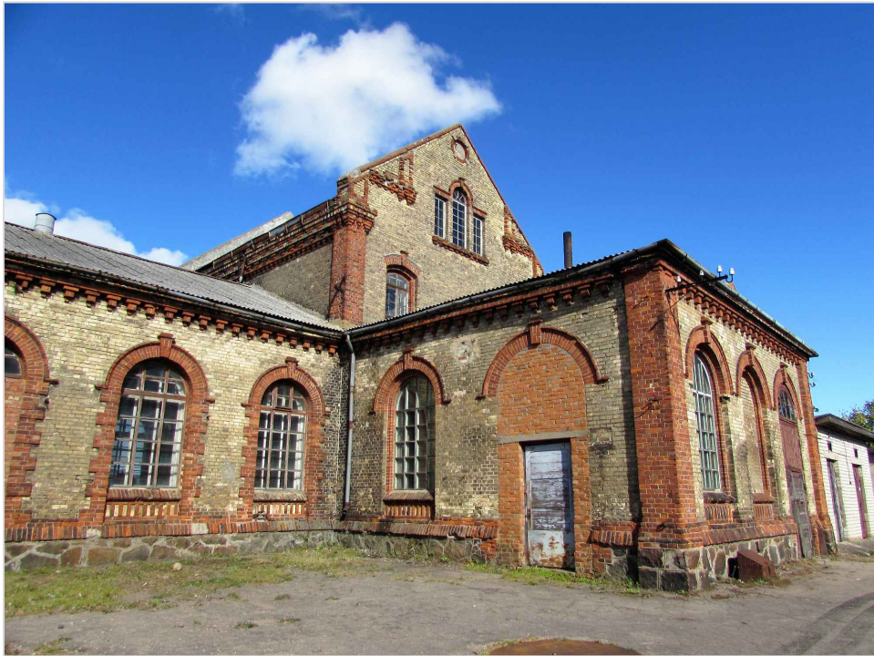
att. 17. Korpuss 3 ar piebūvi 6. Loga ailu dekoratīvā apdare. Skats no ielas puses.