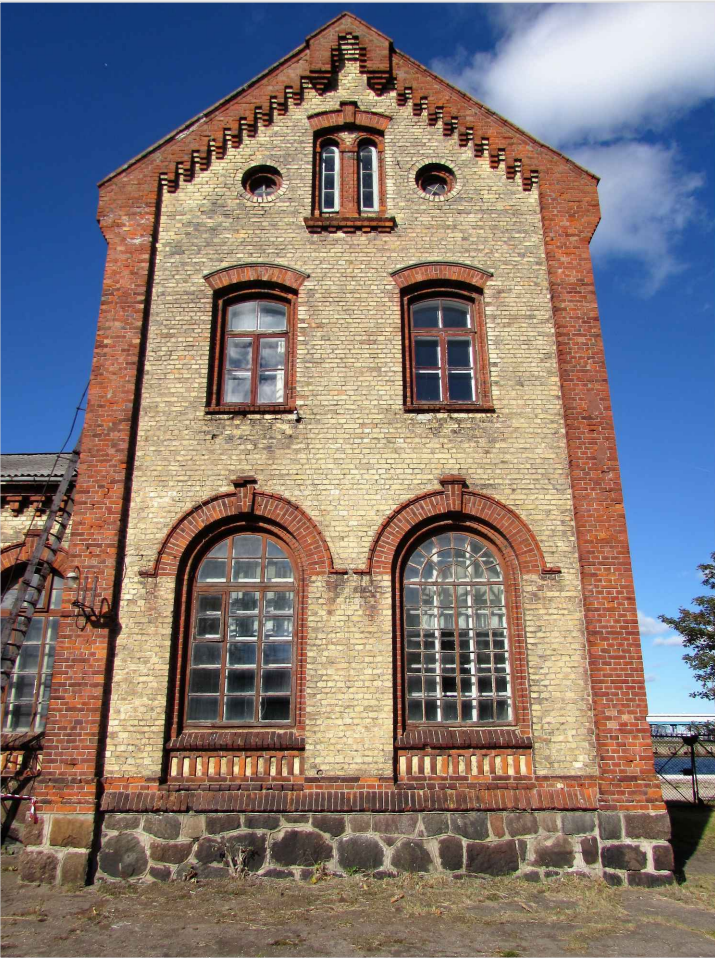
att. 20. Korpuss 1. Skats no ielas puses.